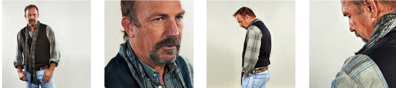
360° Kevin Costner