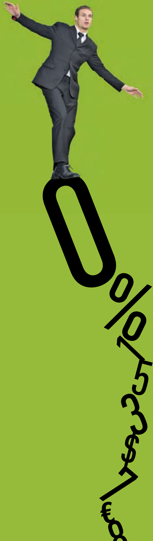
Illustration: Büro Hamburg

Ein Manager, der nur Kennzahlen im Kopf hat, vergisst leicht, dass seine Entscheidungen das Leben vieler Menschen beeinflussen